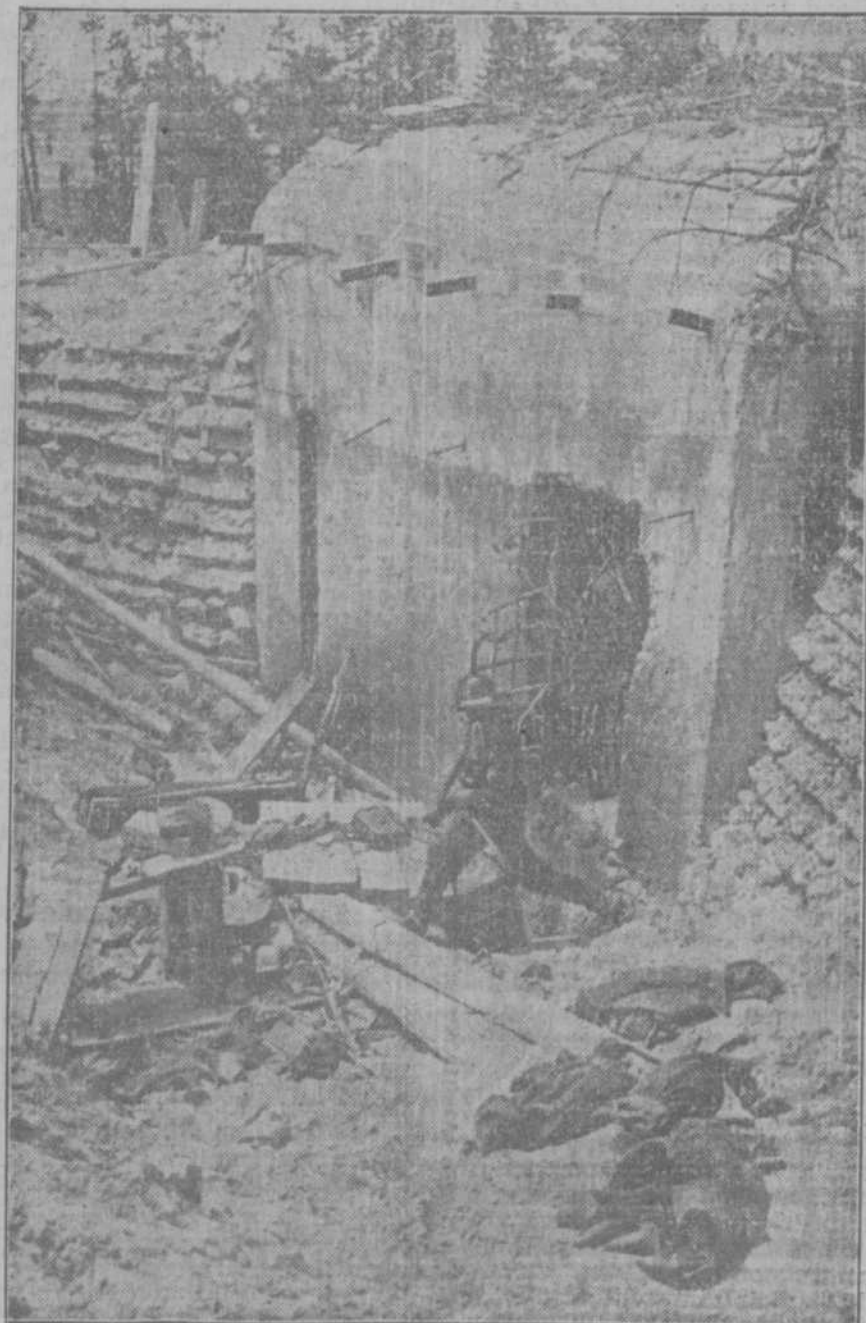
Door de Deutsche troepen veroverd. — Een pantserwerk in de Sovjet-verdedigingslinie, dat niet bestand bleek tegen het zware geschut der Deutsche weermacht (Oris-Holland)